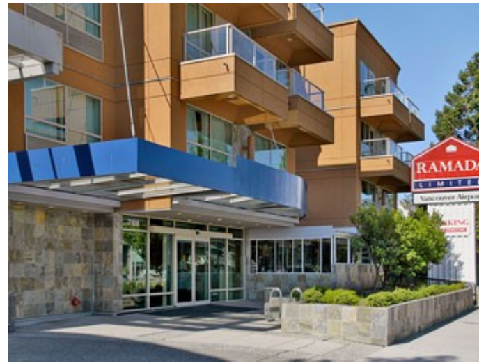
Khách sạn Ramada Seattle Downtown (bên trái) và Ramada Vancouver Airport

Sau cùng, trong chuyến đi công tác vòng quanh Á Châu hai tuần trước, tôi đã giới thiệu với nhiều thân hữu về cuộc sinh hoạt Exryu mùa hè năm nay. Quý thân hữu này gửi lời chúc BTC thành công và chúc quý du khách một chuyến du hành vui vẻ và an toàn.